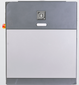
eForce 9.6 kWh